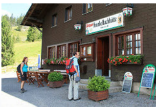
Die Krunkelbachhütte - bekannt auch als Wetterstation - liegt unterhalb des Herzogenhorns auf 1294 m.ü.M.

Mehr Infos über unseren Gegner findet ihr unter: www.sg-alteherren.de